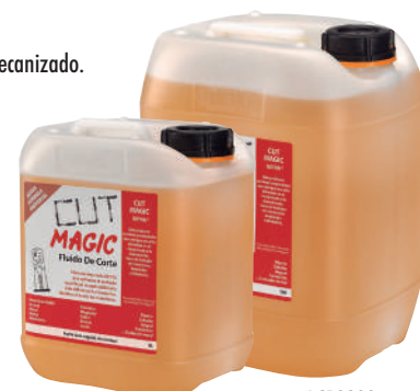
Ref. AC05000 Ref. AC10000

EXP-AC00250 8 U. x 250ml. 144,49 € 200 x 180 x 240mm