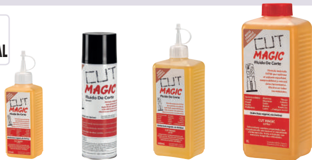
Ref. AC00250 Ref. AC00300AERO Ref. AC00500 Ref. AC01000