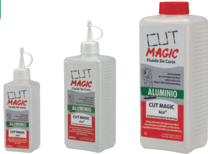
Ref. ACAL00250 Ref. ACAL00500 Ref. ACAL01000