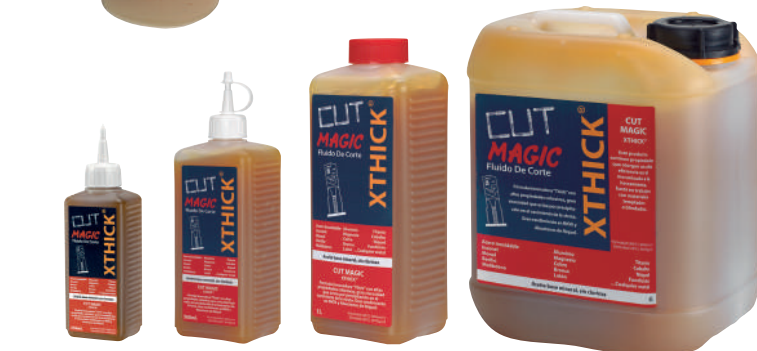
Ref. ACXT00250 Ref. ACXT00500 Ref. ACXT01000 Ref. ACXT05000

EXP-ACXT00250 8 U. x 250ml. 165,76 € 200 x 180 x 240mm